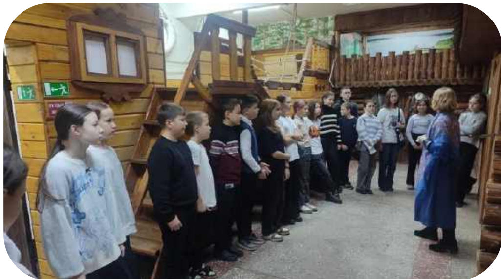
Занятие в Лесосибирском краеведческом музее