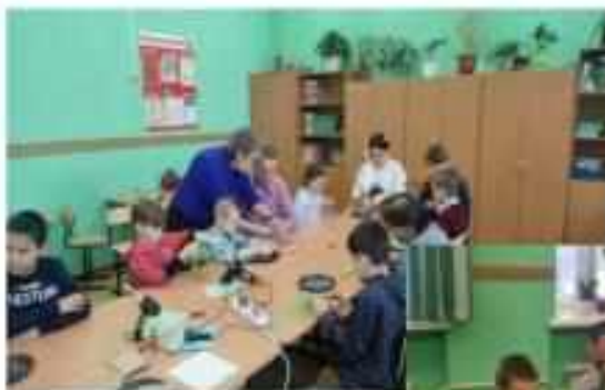
Мастер-класс для всей семьи «Новогодняя игрушка»

СОЦИАЛЬНЫЕ ПАРТНЕРЫ: Отдел опеки и попечительства, защиты прав детства, Комитет по делам несовершеннолетних и защите их прав Администрации г. Лесосибирска, Подразделение по делам несовершеннолетних отдела МВД по г. Лесосибирску, Учреждения дополнительного образования г. Лесосибирска (ДК «Сибирь», ЦДОД, городская библиотека), ГИБДД Центр семьи, ООО ТК «История Сибири», Совет депутатов, Муниципальный центр г. Лесосибирска, Лесосибирская ЦРБ