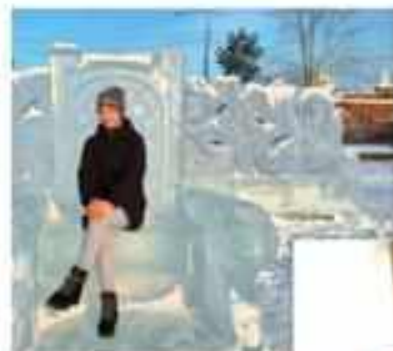
Благотворительная экскурсия «Зимней Енисейск»