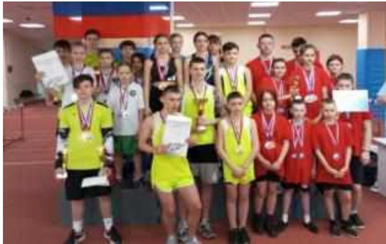
Краевые соревнования по легкой атлетике среди детей с ОВЗ . Команда нашей школы заняла достойное 3 место