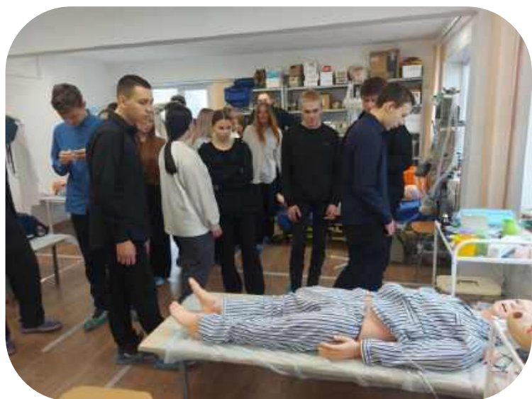
Профпробы в медицинском техникуме