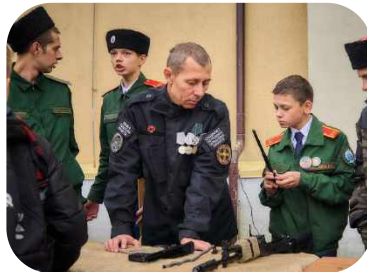
Городская акция «Всё для победы»