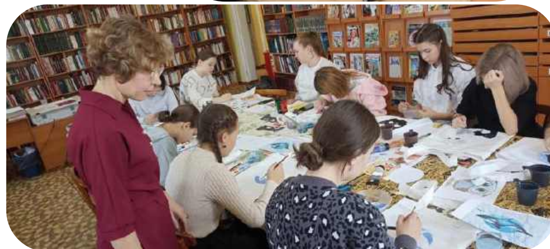
Мастер-класс для учащихся с ОВЗ по изготовлению «Экошоперов» проводят сотрудники городской библиотеки №3