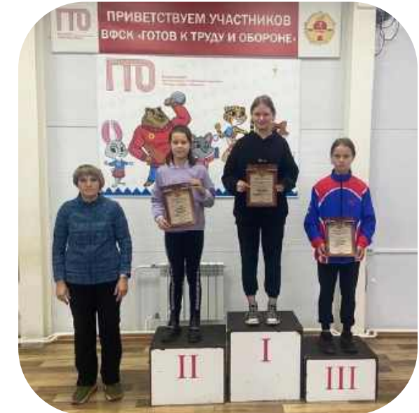
Победители городских соревнований по легкой атлетике (ООП)