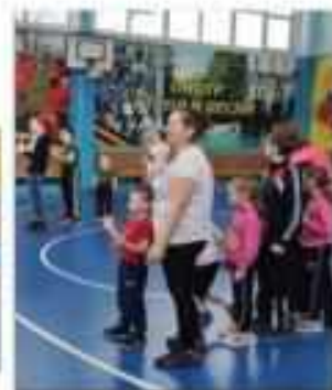
Спортивный праздник «Предновогодняя кутерма»