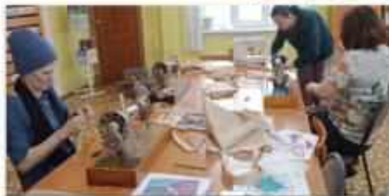
Мастер-класс «Эко шоппер»