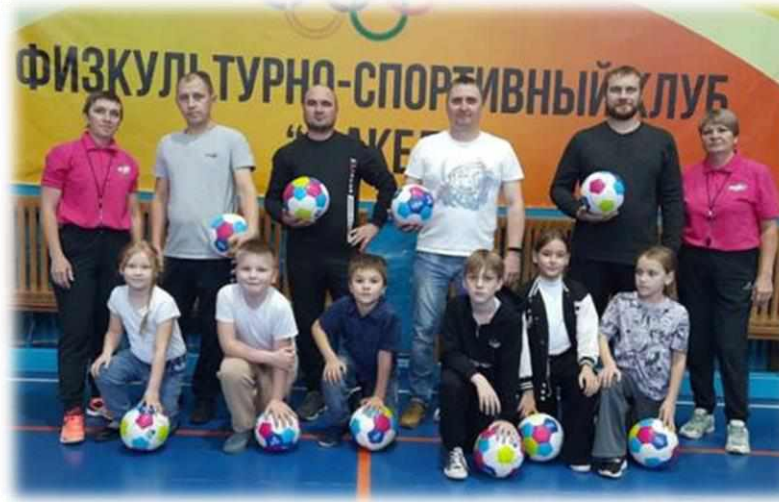
ШСК «Факел» и «Совет Отцов»